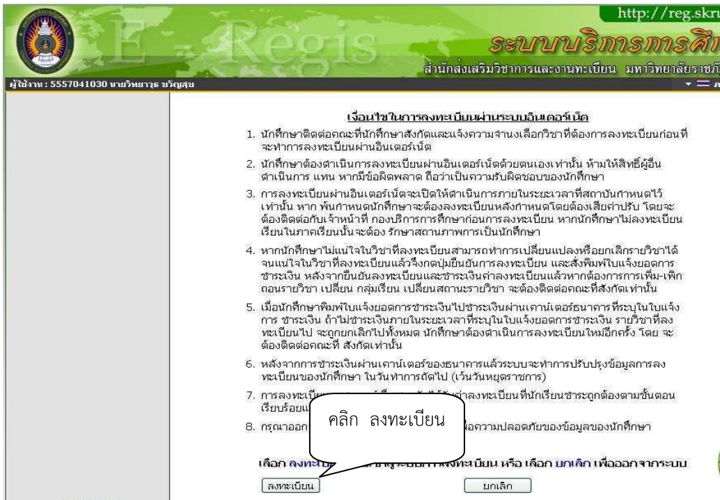
รูปที่ 4 คลิก ลงทะเบียน